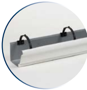
Fixez les supports pour protège-gouttière à la gouttière