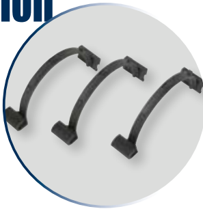
Supports pour protège-gouttière