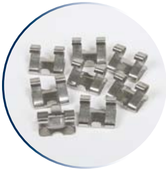
Attaches en acier inoxydable pour protège-gouttière à charnière

Le protège-gouttière à charnière s'installe en quelques secondes avec la pression d'un seul pouce. Ses pratiques sections de 3 pieds conviennent à toutes les gouttières standards en «K». Il suffit de fixer les attaches en acier inoxydable au rebord avant de la gouttière.