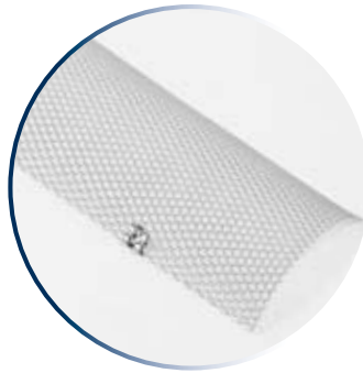
Protège-gouttière avec une attache