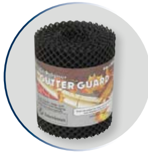
Rouleau de protège-gouttière en plastique