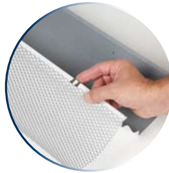
Fixez l'attache au rebord avant de la gouttière